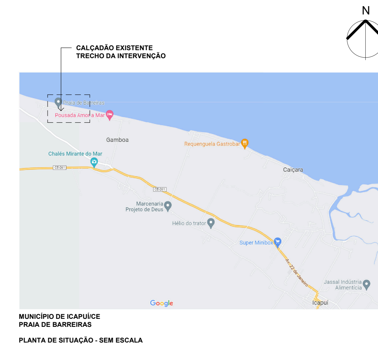
MUNICÍPIO DE ICAPUI PRAIA DE BARREIRAS PLANTA DE SITUAÇÃO - SEM ESCALA