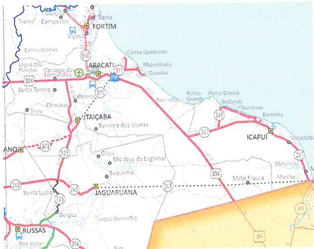
Figura 2 - Município de Icapuí-CE

Agostinho F. de Sousa I Eng. Civil CREA-CE 061505167 CPF 795.731.772-34