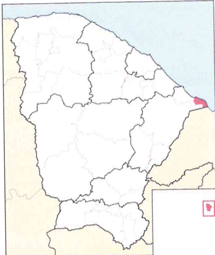
Figura 1 - Município de Icapuí-CE